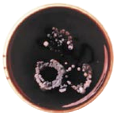
Ringar efter vårdarbete

Andningsskydd i vissa vårdsituationer (skydd mot luftburen smitta)