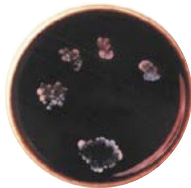
Fingrar efter tvåltvätt