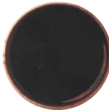
Fingrar efter handdesinfektion