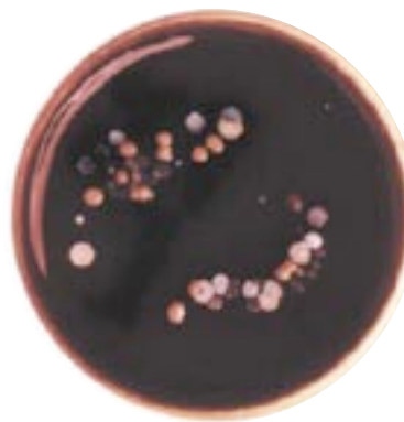
Armband efter vårdarbete