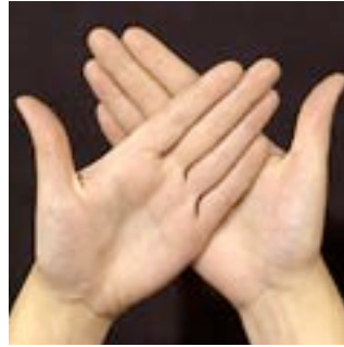
Höger handflata mot vänster handrygg