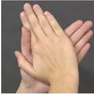
Handflata mot handflata

Det är lätt, tar bara en mycket kort stund och det behövs ca 2-4 ml handsprit.