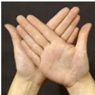
Vänster handflata mot höger handrygg