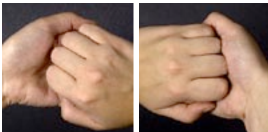
Fingertoppar och naglar