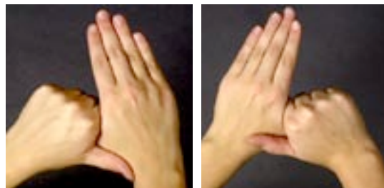
Roterande desinfektion av tummar